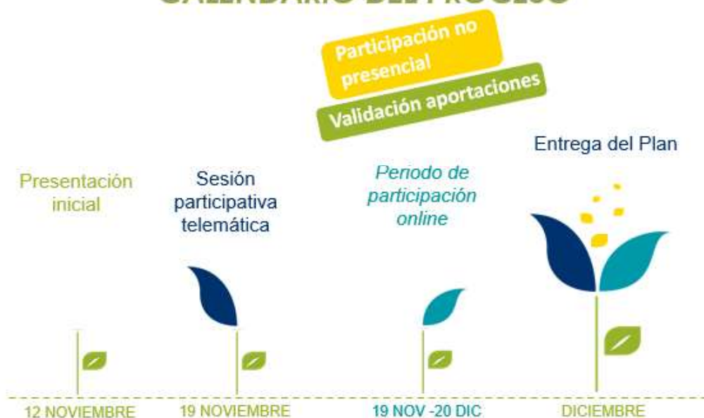
Figura .3 Distribución temporal del proceso participativo.